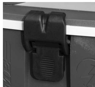
Clip de fermeture

Dégager la tête de l'électrificateur en soulevant le clip de fermeture.