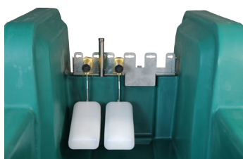
- 2 galleggianti ( 80 lt/min )