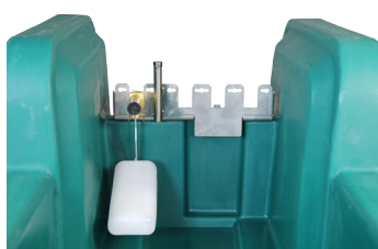
- 1 galleggiante ( 40 lt/min )